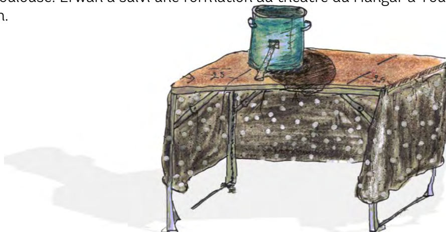
La Cie. De l'Hyppoféroce