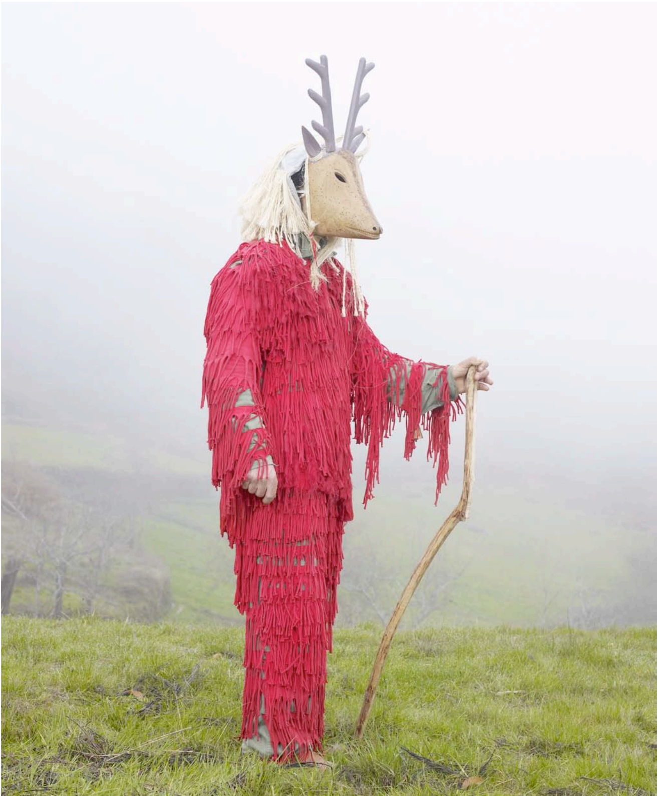
Cartões de Lázaro, Portugal, 2016, de la série WILDER MANN, Charles Fréger