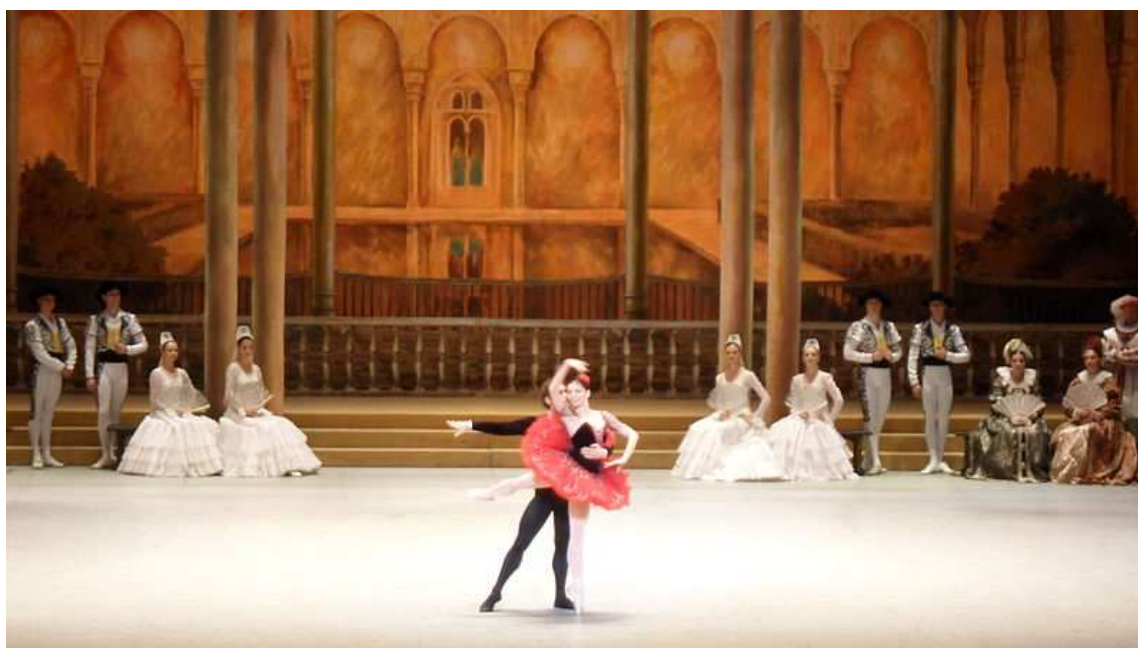
Natalia Osipova et Ivan Vasiliev dans Don Quichotte , 13 mai 2011.