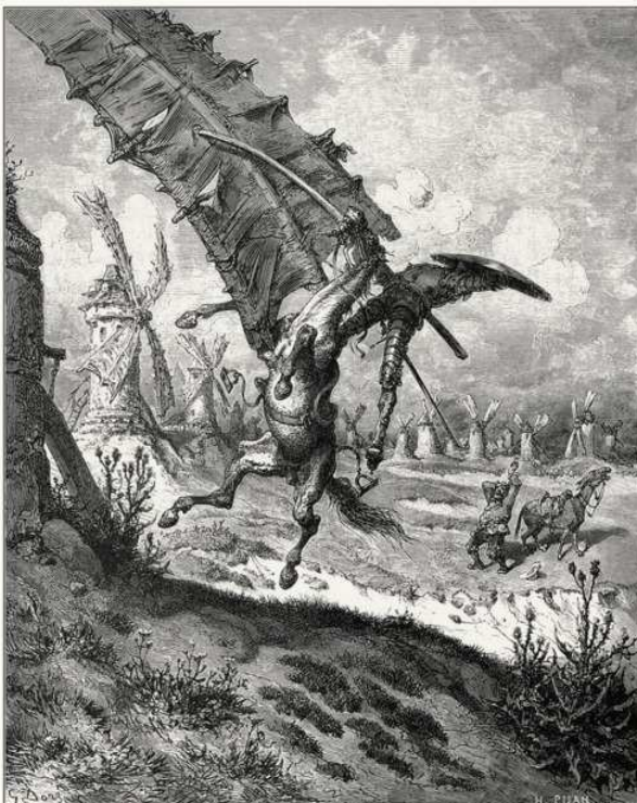
« Sweeping with it horse and rider »

Les illustrations de Gustave Doré (1832-1883) :