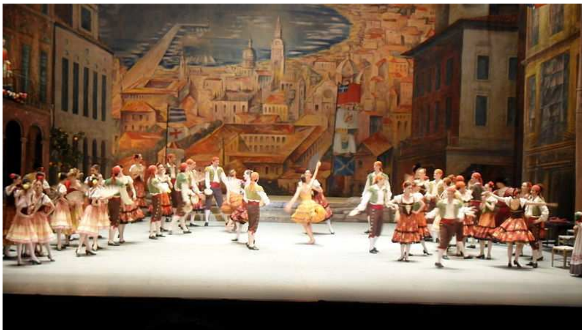
Photographie d'une représentation de Don Quichotte par le Ballet du Bolchoï, 13 mai 2011 ;

Alexei Fadeychev en donne une nouvelle version pour le Bolchoï le 25 juin 1999 qui sera dansée à travers le monde, notamment lors de son passage à Paris en mai 2011 :