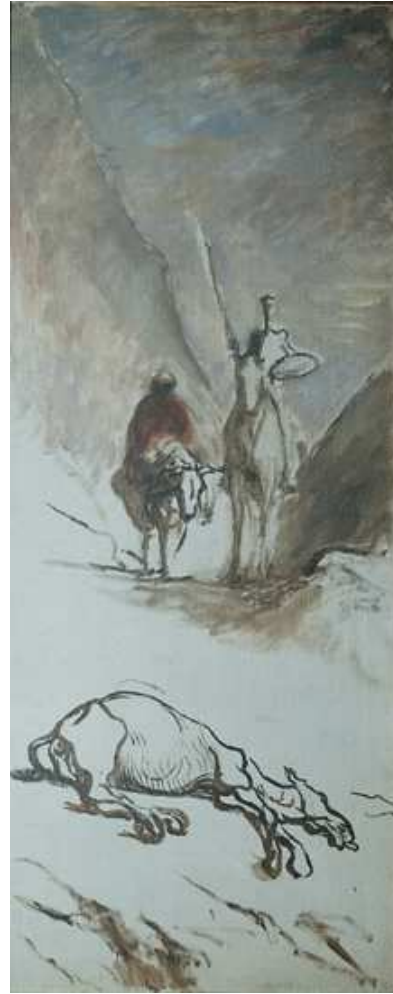
Don Quichotte et la mule morte, 1867.