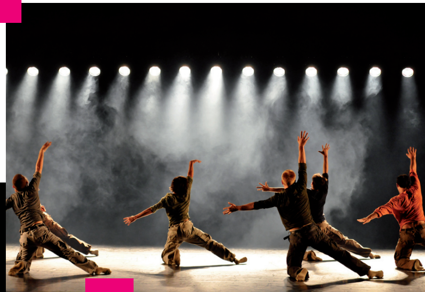
«Uprising» - H. Shechter