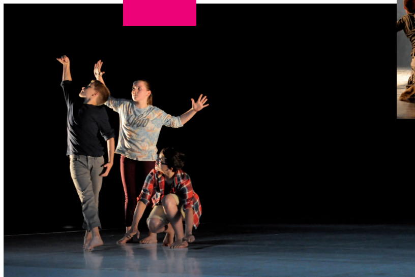
«Brilliant Corners» - E. Gat