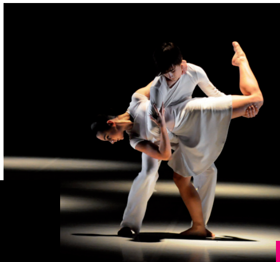
«Déserts d'amour» - D. Bagouet