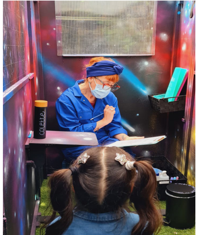
N'oublie pas ce que tu vœux

La musique électroacoustique est le terme définissant les musiques non exclusivement instrumentales, dont des éléments sonores sont enregistrés et reproduits par ordinateurs ou bande magnétique. Elle puise ainsi son origine à