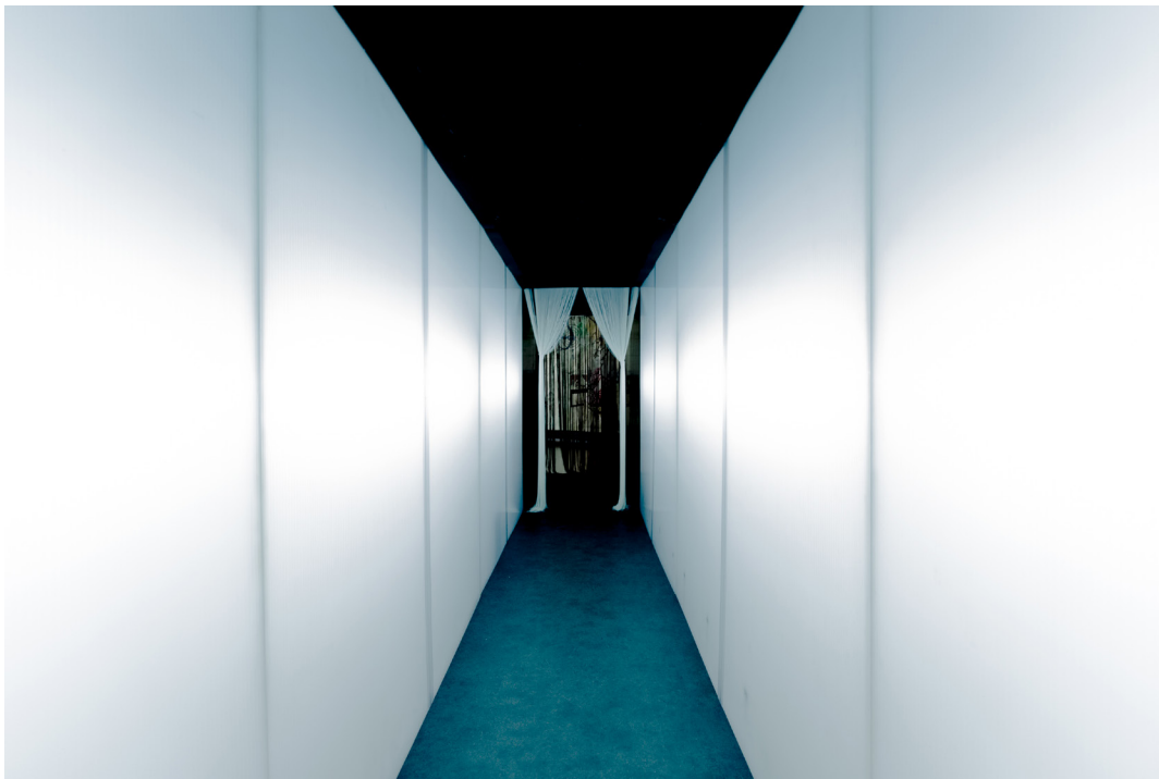
Passage © Gilles Vidal

Balisé par un ensemble de capteurs, les mouvements des personnes dans Passage influent sur l'environnement sonore et visuel et la séquence initiale est ainsi transformée au gré des gestes du marcheur, l'installation agissant un peu comme un miroir du comportement.