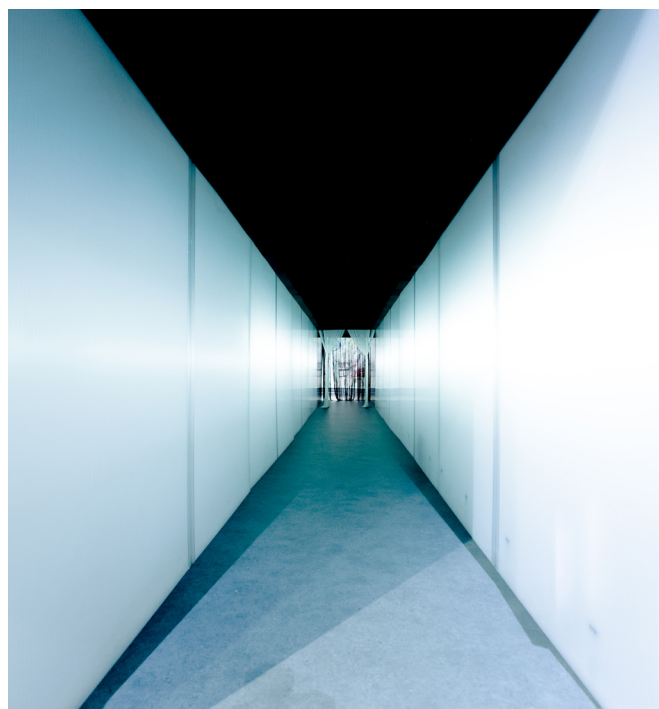
Passage