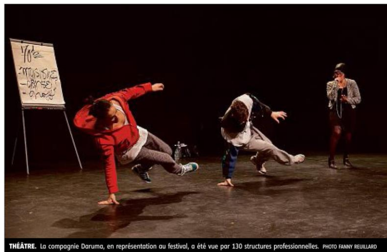
THÉÂTRE. La compagnie Daruma, en représentation au festival, a été vue par 130 structures professionnelles.

« On était venu une première fois, il y a trois ans et ça nous avait permis de se faire connaître en dehors de l'Auvergne. » Depuis le 2 juillet, la compagnie de danse clermontoise Daruma a pris ses quartiers dans la