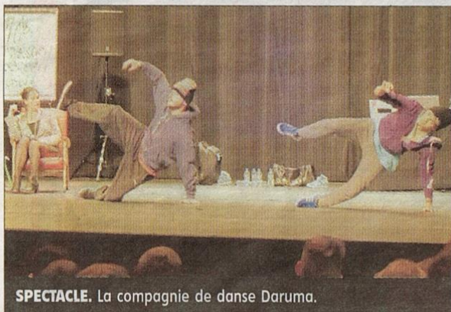
SPECTACLE. La compagnie de danse Daruma.

Près de 250 élèves de Châtel-Guyon, Laps et Pontgibaud sont venus au théâtre pour suivre la conférence dansée « Hip-hop or not » de la compagnie régionale Daruma.