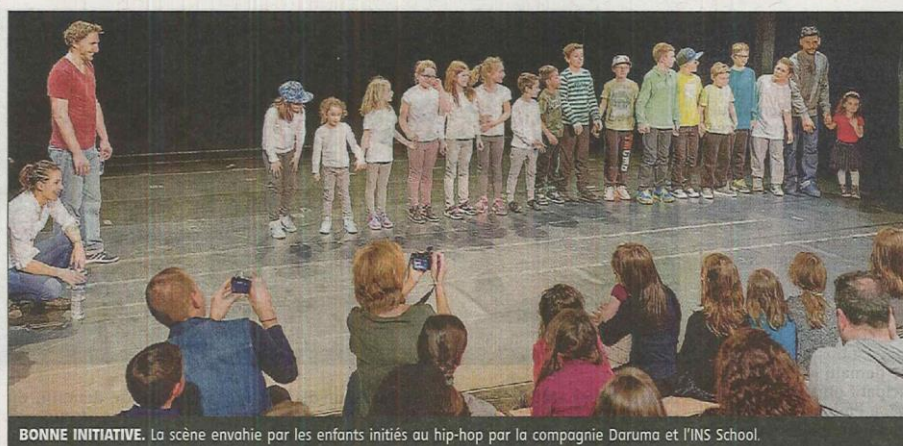
BONNE INITIATIVE. La scène envahie par les enfants initiés au hip-hop par la compagnie Daruma et l'INS School.

Le service Animation de la commune a innové en insérant dans sa programmation culturelle, un spectacle de danse, dimanche à l'espace culturel Les Justes.