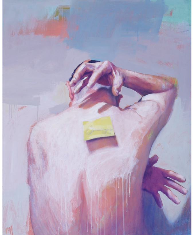
Cent-titre / © P.Hérard

Site de l'artiste : https://www.phherard.com