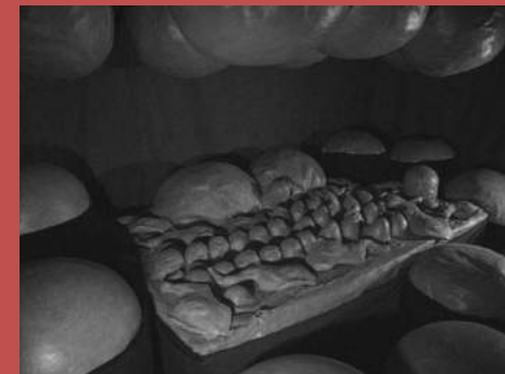
The destruction of the father 1974