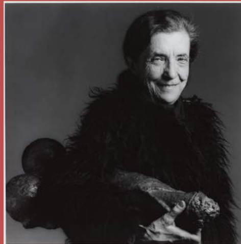
Portrait de Louise Bourgeois tenant « Fillette », 1982

« ... Je suis mon œuvre. Je m'incarne dans les objets que je fabrique » Louise Bourgeois