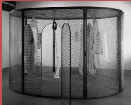
Peaux de lapin, chiffons ferrailles à vendre 2006