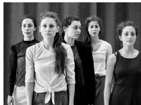
Répétitions mai 2018, accueil studio Pôle danse CMN / L'hélice