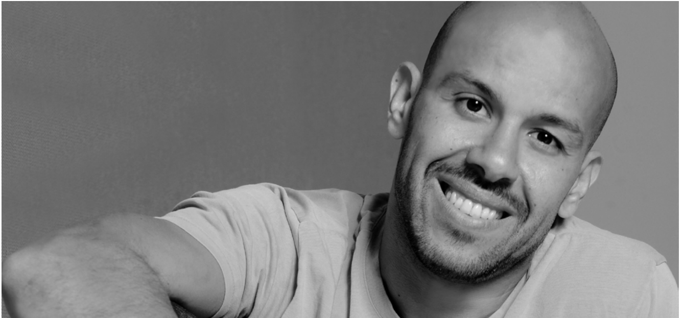
Figure du mouvement hip-hop depuis le début des années 1990 , le chorégraphe inscrit son travail au carrefour de multiples disciplines. Autour de la danse hip-hop explorée dans tous ses styles, se greffent le cirque, les arts martiaux, les arts plastiques, la vidéo et la musique live. Sans perdre de vue les racines du mouvement, ses origines sociales et géographiques, cette confrontation permet d'ouvrir de nouveaux horizons à la danse et dégage des points de vue inédits.