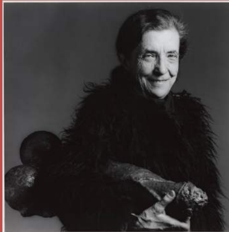
Portrait de Louise Bourgeois tenant « Fillette », 1982

« ... Je suis mon œuvre. Je m'incarne dans les objets que je fabrique » Louise Bourgeois