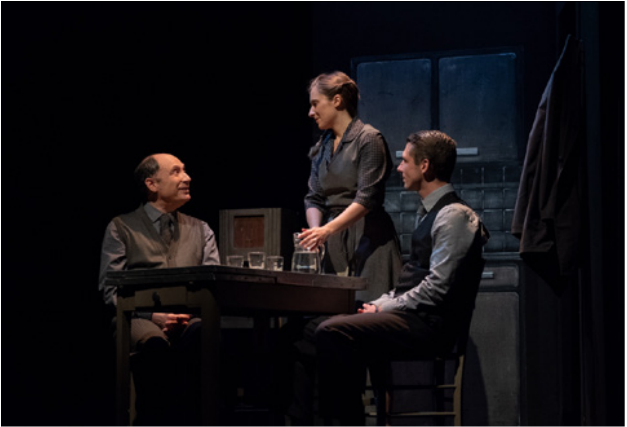
Marc Siemiatycki / Pauline Caupenne / Benjamin Brenière © Grégoire Matzneff