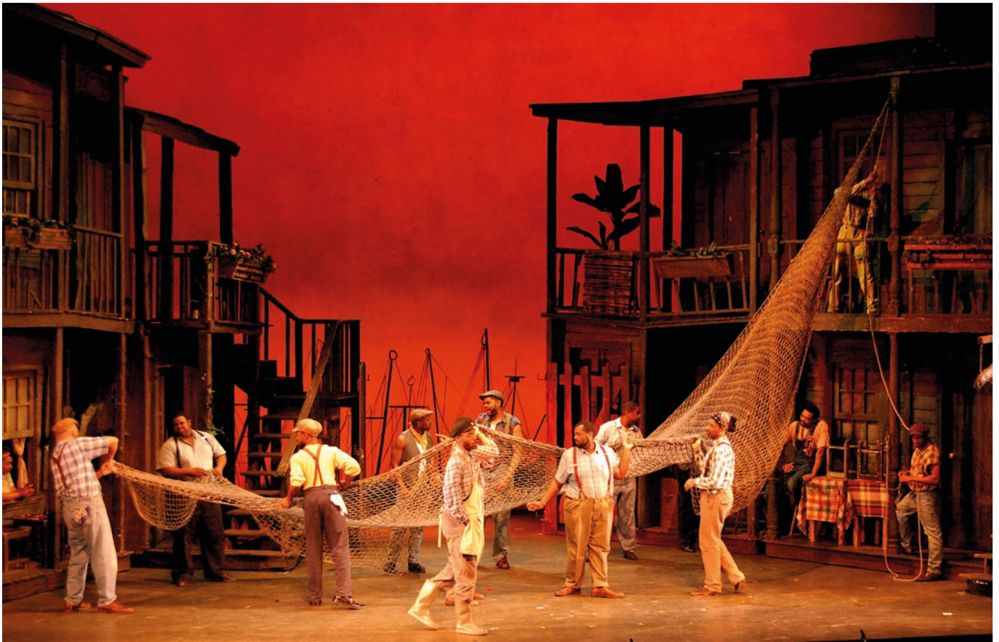
Borgy and Bess, Odyssud2015. P. Rioux

Il laissa libre cours à presque toutes les fantaisies des musiciens, dégageant l'individu de la masse pour en arriver aux fameux combos qui allaient faire fureur à partir de la fin des années 1940.