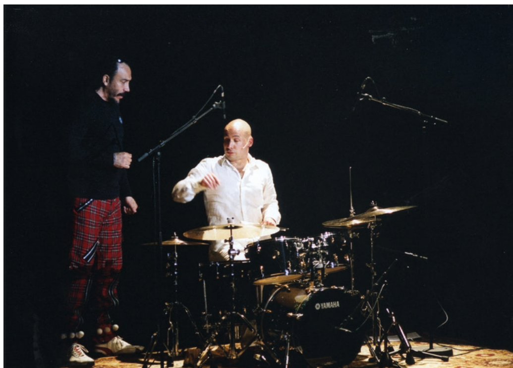
Ali Baba et les 40 Batteurs, Odyssud 2008.