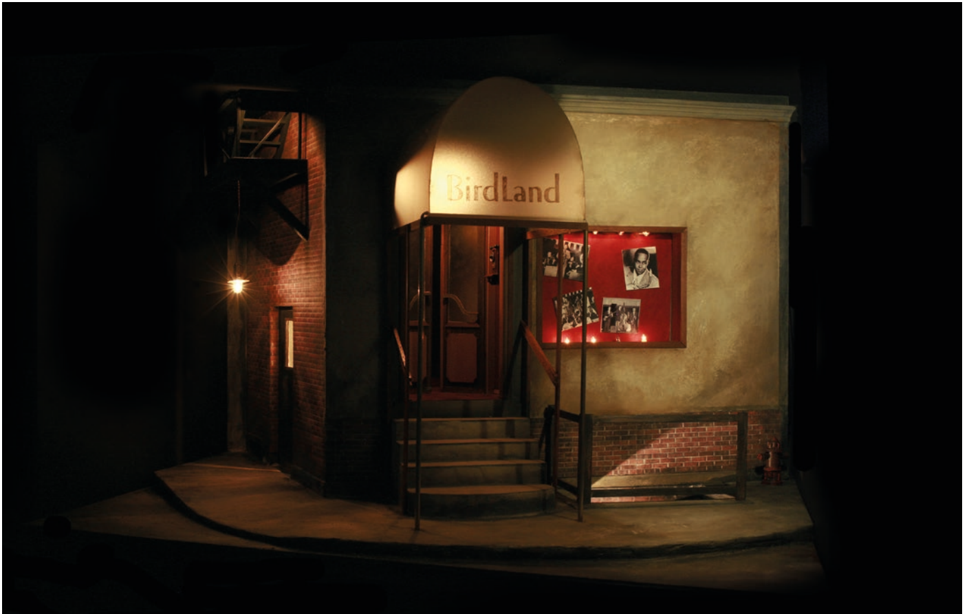
New York