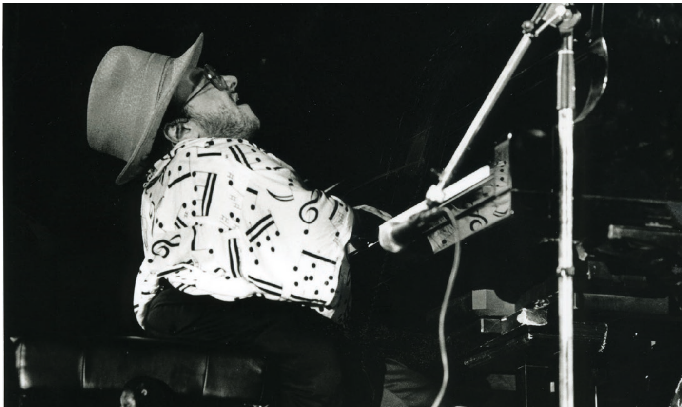
Michel Petrucciani, Odyssud 1996.

En 1954, Billie fait sa première tournée en Europe. En 1956, la santé de Billie se dégrade. Elle meurt à l'hôpital en juillet 1959.