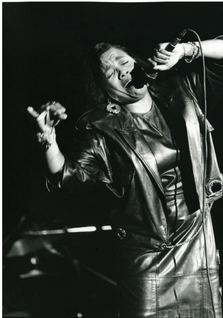
Dee Bridgewater, Odyssud1994.

Johnny Hodges est un de ceux qui poussa la maîtrise de son instrument à son plus haut point. Son sens aigu de l’équilibre dans la construction de ses solos est allié avec un son expressif, sensuel sans être mièvre, une belle finesse mélodique et une grande précision rythmique. Il est un des rares musiciens en qui le jazz a incarné son propre classicisme.