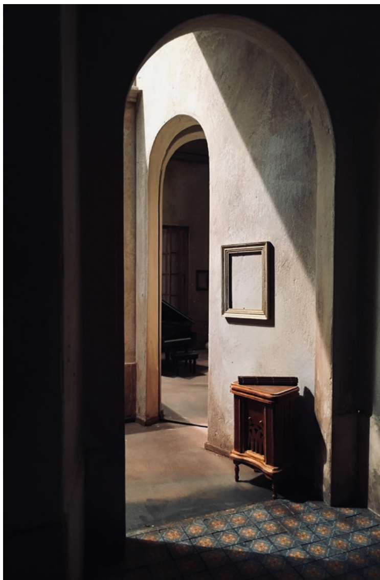
Cuba-détail, image de G.-Kerbaol

Identifier les instruments ou segments d'un morceau et attribuer à chaque instrument ou chaque segment musical un geste, un mouvement. Ecouter ensemble le morceau, chaque participant dansera son instrument/son segment à chaque fois qu'il jouera.