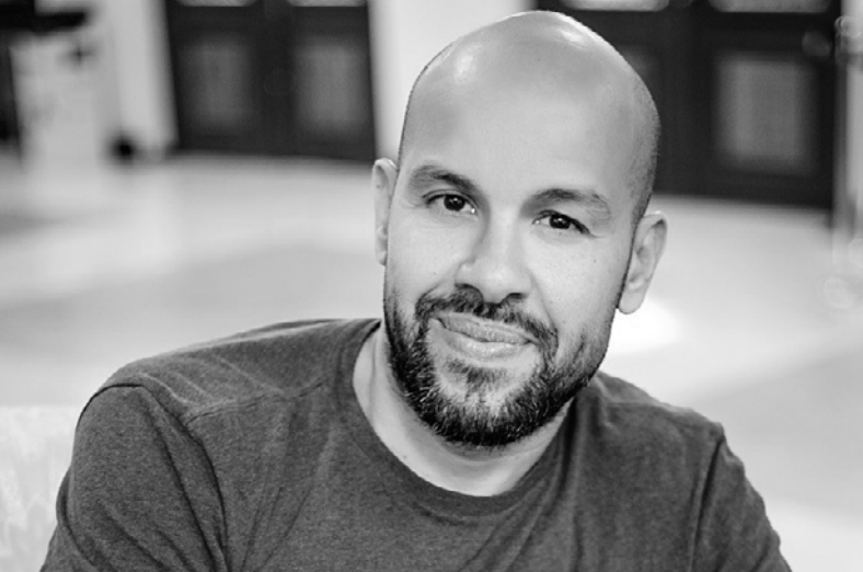
Figure du mouvement hip-hop depuis le début des années 1990, le chorégraphe inscrit son travail au carrefour de multiples disciplines. Autour de la danse hip-hop explorée dans tous ses styles, se greffent le cirque, les arts martiaux, les arts plastiques, la vidéo et la musique live. Sans perdre de vue les racines du mouvement, ses origines sociales et géographiques, cette confrontation permet d'ouvrir de nouveaux horizons à la danse et dégage des points de vue inédits.